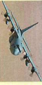
C-130H輸送機×1機 (又はC-2、C-1輸送機)